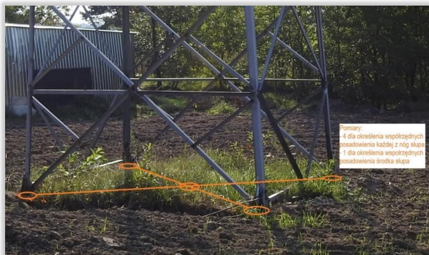
Grafika 1 Przykładowa metodyka określenia współrzędnych posadowienia konstrukcji linii 110 kV, punkty pomiarowe zaznaczono kolorem pomarańczowym